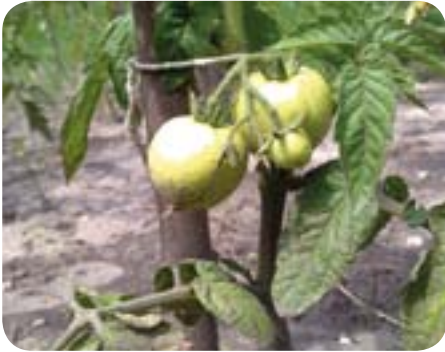
Fot.: Sonia Priwiezienczew